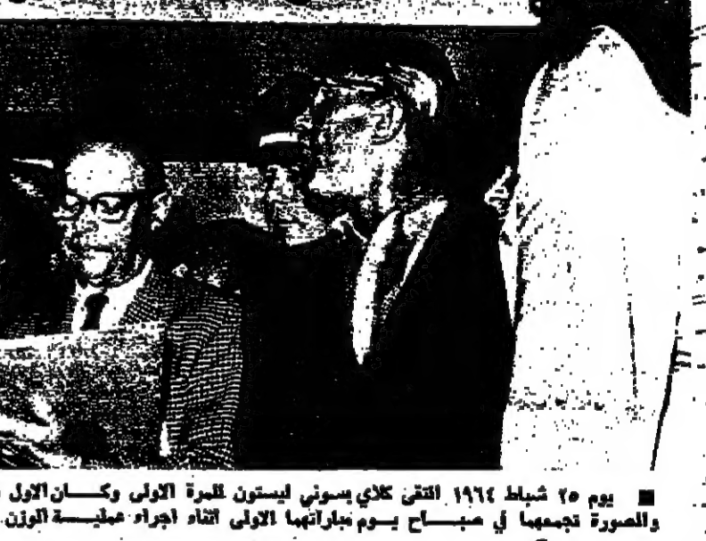
يوم ٢٥ شباط ١٩٧٤ التقى كلاي بسوني ليستون للمرة الأولى وكان الأول بطلا اولى وبعدها بطلا العالم والصورة تجسهما في صباح يوم مبارياتها الأولى اتاد اجراء عملية الون.